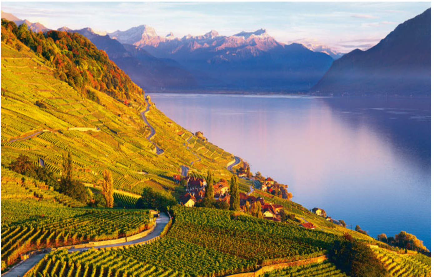
Lavaux am Genfersee